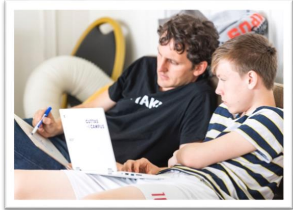
Guttas Campus kull 2020 Oslo

Positive holdninger til skolen smitter ofte over på barna. Det er derfor lurt å snakke positivt om lærerne og om skolen, selv om du er uenig med skolen noen ganger. Du kan selvfølgelig vise denne uenigheten overfor barnet hvis barnet er involvert i saken, men det hjelper aldri å snakke negativt om skolen. Et eksempel kan være at du er uenig i at barna skal ha lekser hjemme. Selv om lærer gir lekseoppgaver hjemme, bør forelderen støtte barnet i å gjøre leksearbeidet, oppmuntre til det og gi ros for innsatsen.